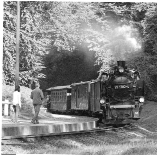
M3 Der „Rasende Roland“ auf Rügen