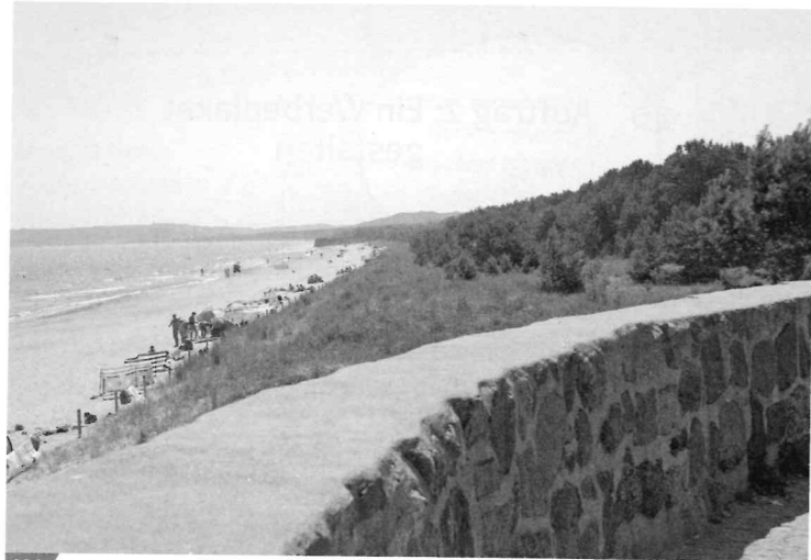
M1 Flachküste auf Rügen