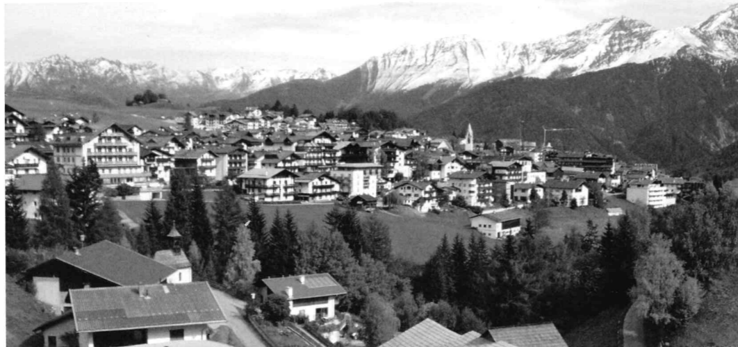
M2 Der Ort Serfaus